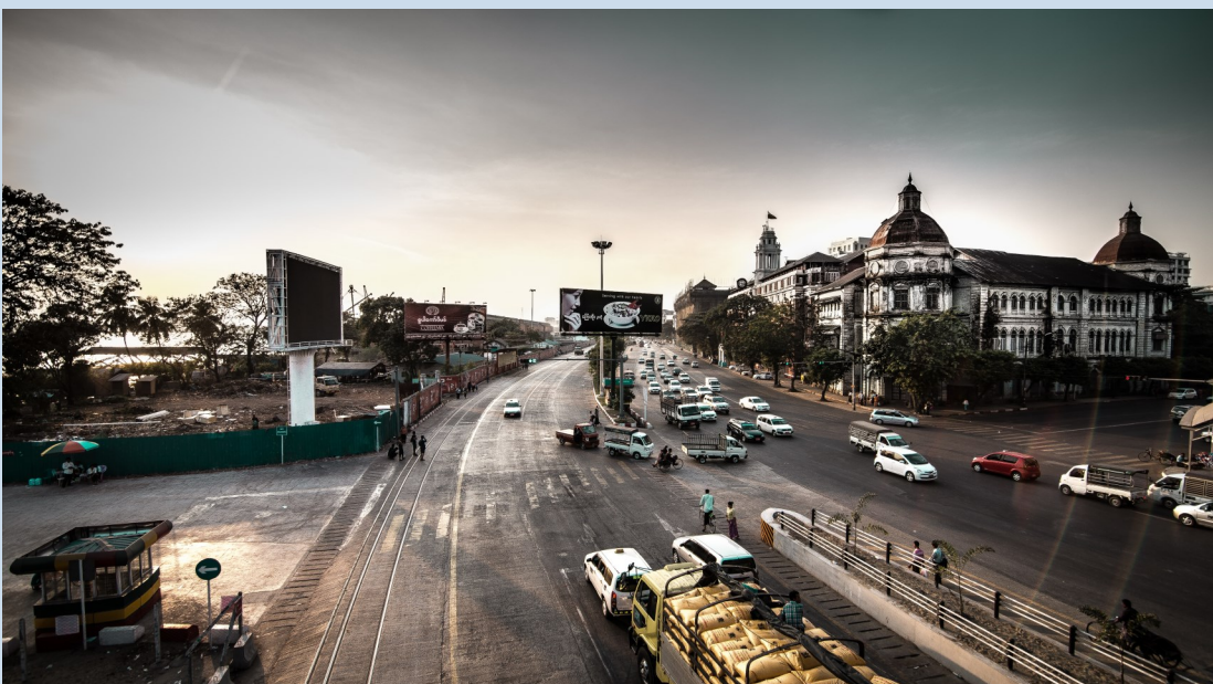
Innenstadt von Yangon